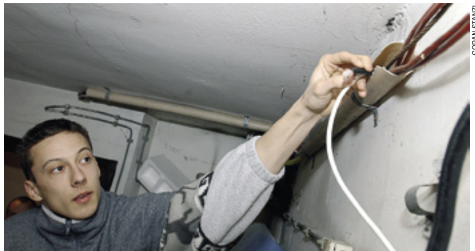
K. Fabina pokazuje kabel kojim se Antena J.D. priključila na njihovu mrežu

KABELSKA TELEVIZIJA: Dugavljani tvrde da ih koncesionar vara