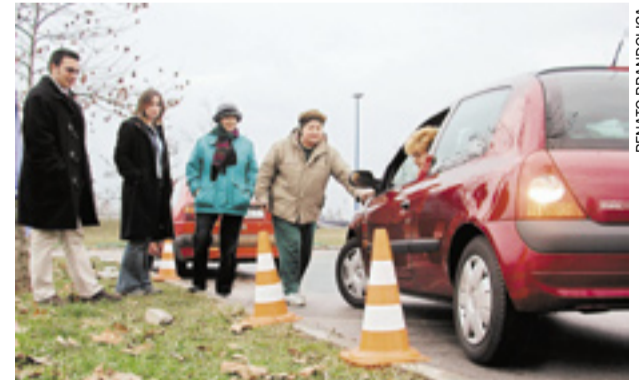
“Udružene vozačice” pomažu u vježbanju parkiranja

Organizatorice tečajka kažu da većinom dolaze vježbati žene. (Ž. Ma.)